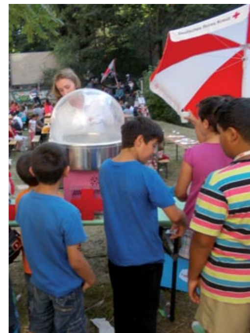
Mehr als 400 große und kleine Gäste besuchten das diesjährige Sommerfest.