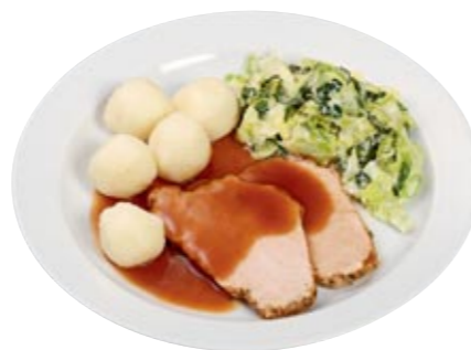
Krustenbraten vom Schwein in herzhafter Malzbiersoße, dazu Rahmwirsing und Kartoffelknödel, zu bestellen am 22.09.2013, 26.09.2013, 04.10.2013 und 13.10.2013.

Genießen Sie einfach zwei Hähnchenunterkeulen auf bayrischem Weißkohl-Gemüse, dazu Stampfkartoffeln oder den Süßen Kirschmichel mit Vanillesoße. Eine weitere leckere Überraschung ist unser Krustenbraten vom Schwein in herzhafter Malzbiersoße, dazu Rahmwirsing und Kartoffelknödel.